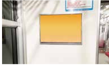
普通列車B額面 イメージ