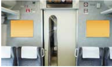
特急列車B額面 イメージ