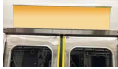
普通列車C額面 イメージ